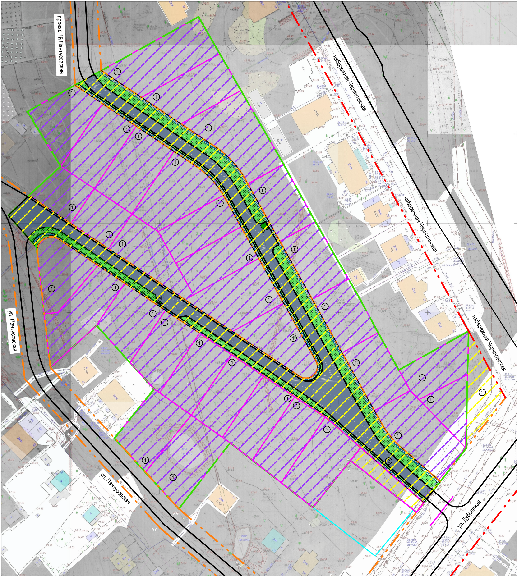
Границы функциональных зон в соответствии с Генпланом г. Костромы