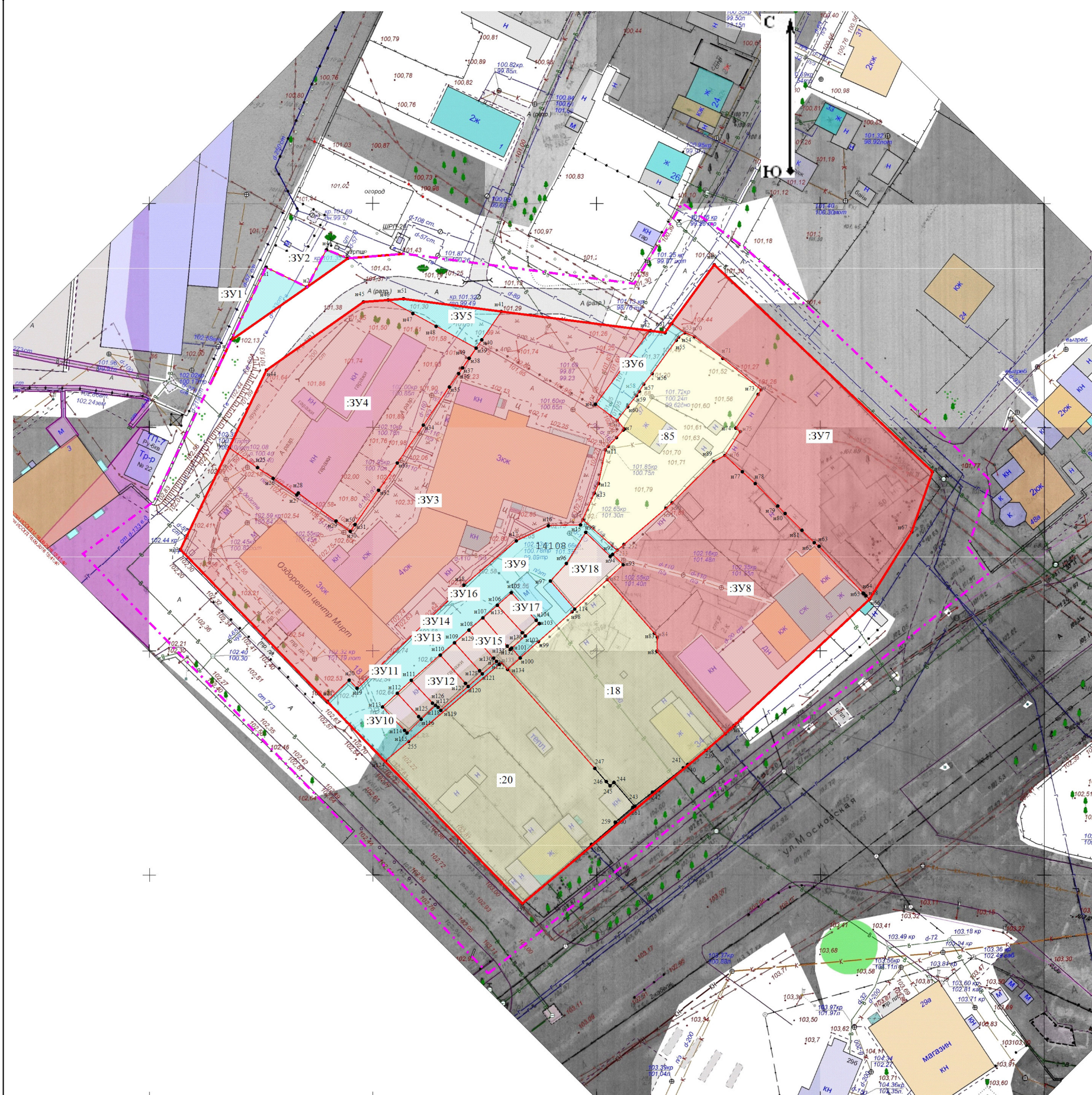
Масштаб 1:1 000