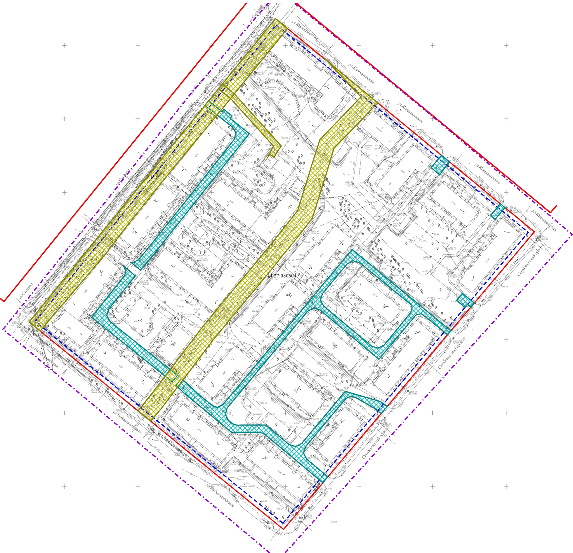
Масштаб 1:1 500